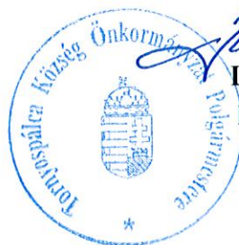
Lukácsi Attila Lukácsi Attila polgármester